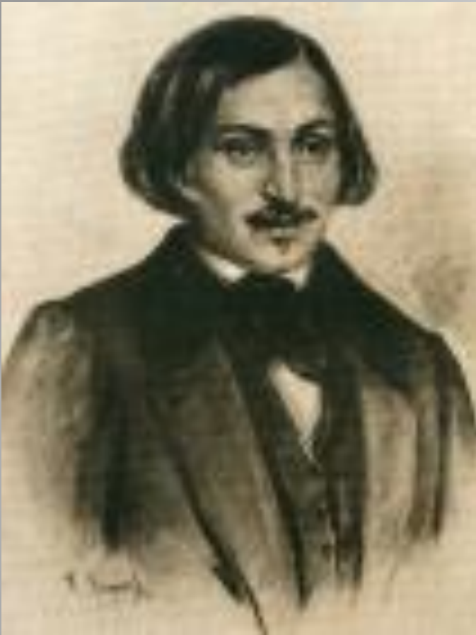
Николай Васильевич Гоголь